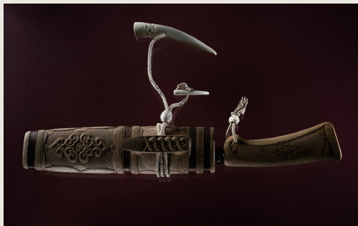
藤戸幸夫《タンロ》2020年 公益財団法人アイヌ民族文化財団蔵