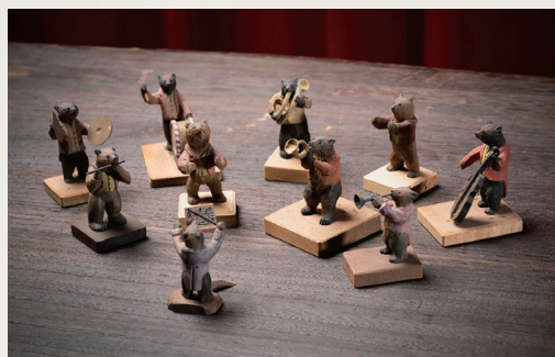
八雲農民美術研究会《熊の音楽隊》 昭和期、個人蔵、八雲町郷土資料館寄託