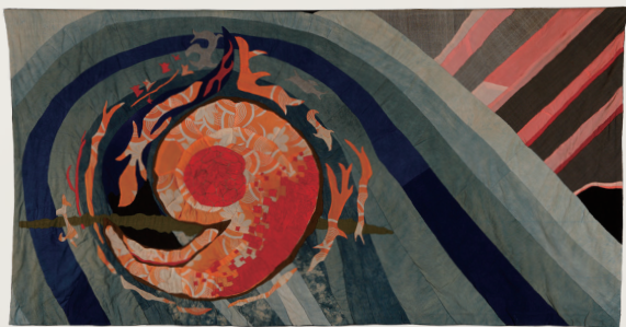
川村則子《Spirit of the Ainu》1998年、公益財団法人アイヌ民族文化財団蔵