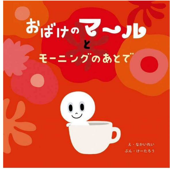
新作『おばけのまるとモーニングのあとで』表紙 2021年