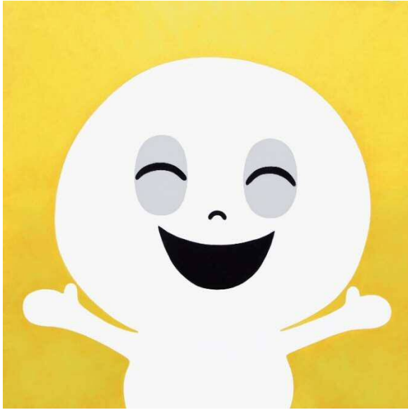
『おばけのまるとすてきなことば』原画の下絵 2020年