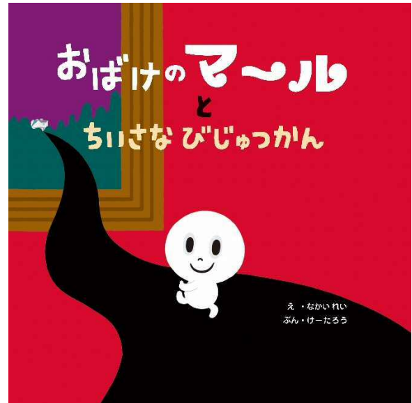
『おばけのまるとちいさなびじゅつかん』表紙 2008年