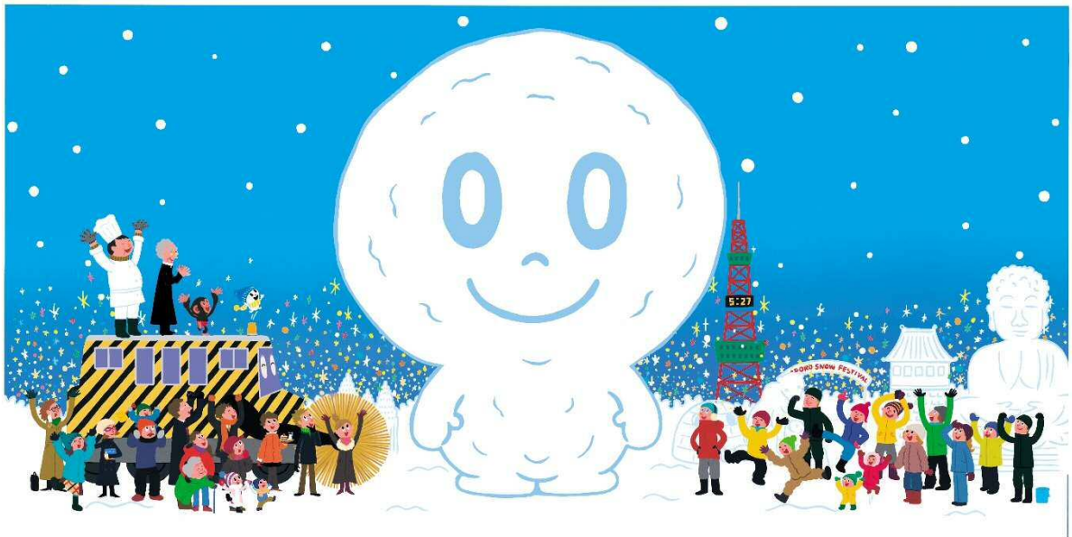
『おばけのマールとゆきまつり』原画 2006年