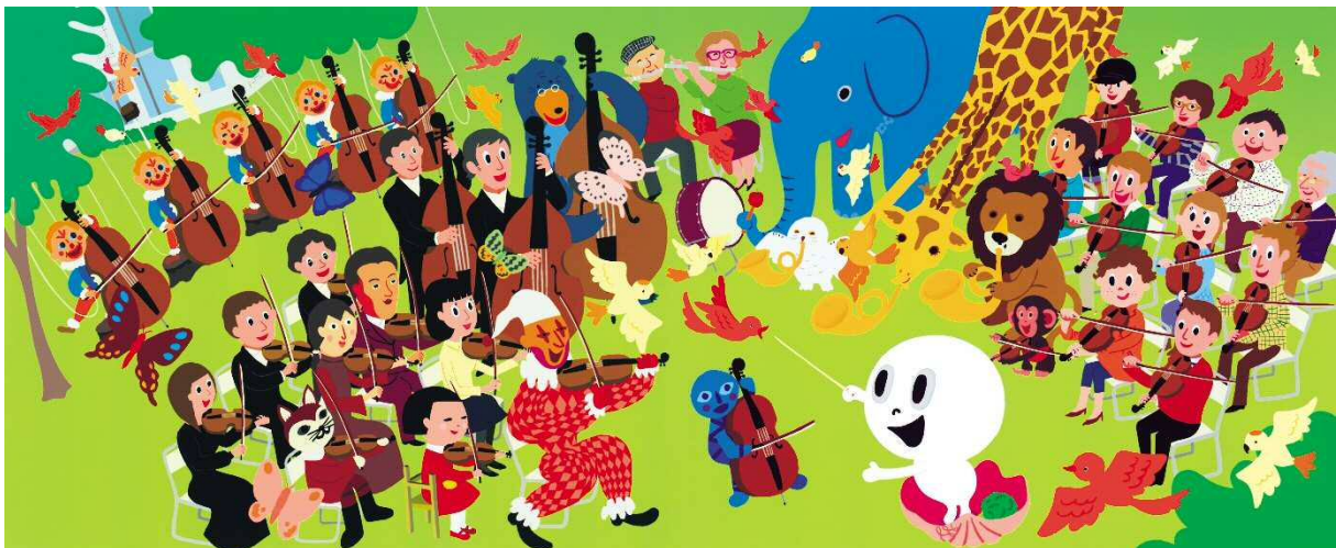
『おばけのマールとちいさなびじゅつかん』原画 2008年