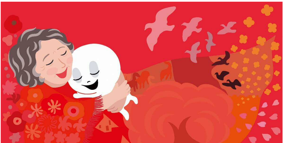
絵本「おばけのマールとモーニングのあとで」(文・けーたろう 中西出版)原画 2021年 なかいいい